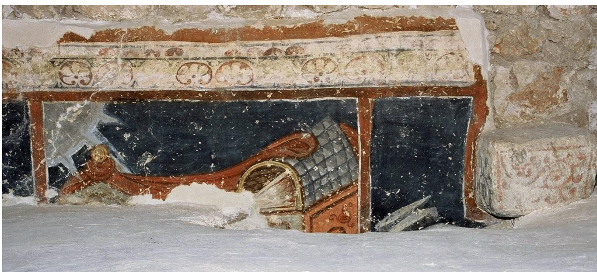
Ostaci freske na sjevernom zidu sakristije

Svojevrsna „igra prozorima“ nije time potpuna. Sakristija je, prije nego je dobila visoko podignute gotičke prozore, na svojoj istočnoj strani imala romaničke prozore. Da su to doista njezini izvorni prozori potvrđuju ostaci dviju kamenih prozorskih igala što se vide na vanjskoj fasadi. Jedna prozorska igla vidljiva je iz lapidarija, a druga iz malog dvorišta južno od kapele. 11 Njihov početak je na visini od oko 330 cm od izvornog poda sakristije. Po ostatku prozora iznad svoda, zaključuje se da su na mjesta romaničkih u jednom trenutku kasnije ugrađeni šiljasti gotički prozori, koji su mogli započinjati otprilike