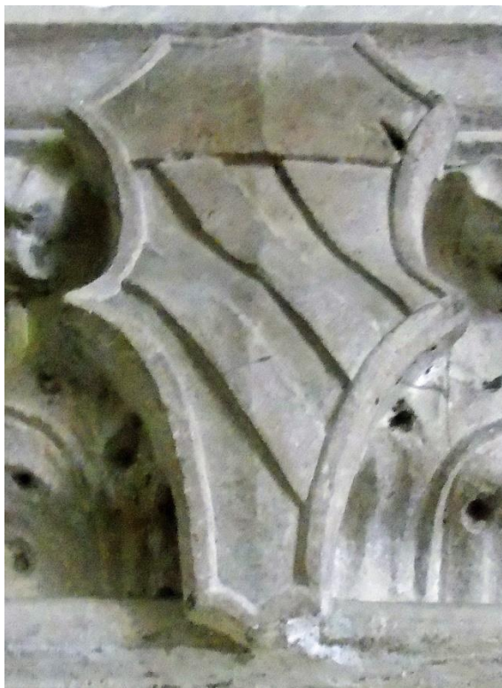
Grb obitelji Gučetić

Do nedavno se smatralo kako je sakristija od početka imala svod, i kako je, izuzevši kapelu na istočnoj strani, sačuvan njezin izvorni oblik. Novije spoznaje govore međutim o više promjena njezinog izgleda. O promjenama svjedoče najviše ostaci što ih je na svjetlo dana donijela nedavna obnova istočnog samostanskog krila. I prema njima, ona je u početku bila pravokutna prostorija. Ostaci međutim otkrivaju kako je na istočnoj strani u određenom vremenskom razdoblju imala gotičke prozore. Bili su podignuti visoko, tako da su im šiljasti vrhovi dopirali gotovo do samoga stropa. O tome svjedoči ostatak vrha takvog prozora u istočnom zidu blizu sjeverne strane. On je iznad današnjeg svoda i odaje logične položaje tadašnjih drugih prozora. O vrhovima drugih nisu ostali tragovi, jer su uklonjeni kad je u taj zid ugrađen luk kapele. Svod je u sakristiju ugrađen 1509., kako stoji u dozvoli što ju je 2. siječnja te godine franjevcima dao Senat (Vijeće umoljenih). 4 Kod toga posla bio je jamac vlastelin Ambroz Marinov Gučetić. 5 Tu činjenicu pojašnjavaju grbovi obitelji Gučetić na kapitelima. Njihovi grbovi su po dva na južnoj, zapadnoj i sjevernoj strani. 6 Samo na kapitelima na zidu istočne strane nema takvih grbova, jer su zasigurno uklonjeni kod izgradnje kapele.