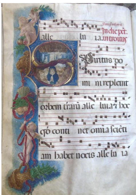
Gradual de tempore „H“, f 67v

ministra Reda Male braće, pa nakon toga dubrovačkog nadbiskupa od 1510. do 1518. Nadbiskup je graduale 1518. darovao crkvi svojega rodnog mjesta, Crkvi sv. Franje u Bagnacavallo (provincija Ravena), a danas se čuvaju u tamošnjoj knjižnici. Zbog toga što su rukopisi nastali za vrijeme biskupstva Graziana, i zbog slike nadbiskupa i Dubrovnik u njima, Brlek se pita: „tko je sitnoslikao i gdje su sitnoslikani korali?“, i zaključuje: „...ali iz svega izlazi, da je umjetnik poznavao i nadbiskupa Graziana i Dubrovnik. Da li je on Dubrovčanin, da li je gradual rađen u Dubrovniku ili na Daksi, gdje dvadesetak godina kasnije sitnoslika fr. Bernardin Gučetić...“ 41 Dubrovački franjevac Bernardin Gučetić (Gozze) (1495. – 1569.) krsnim imenom Marin a nadimkom Gerić, bio je u to vrijeme, kako i Brlek pretpostavlja, premlad da bi iluminirao ove kodekse, jer je riječ o knjigama što su nastale od 1510. do 1518. Njega je vrlo vjerojatno poučavao onaj koji je na Daksi iluminirao Grazianove graduale, kao i gradual Male braće „H“, fra Adartin iz Verone a spominje se kao minijaturist u Samostanu Male braće u 15. stoljeću? Uz njega se možda može vezati i izrada intarziranih sakristijskih ormara?