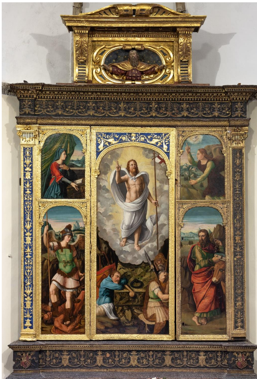
Poliptih na oltaru moćniku