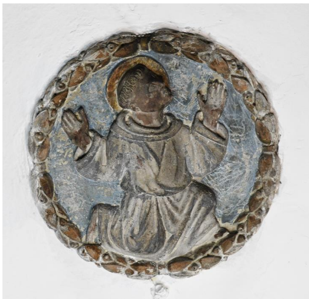
Reljef sv. Franje na današnjem svodu sakristije