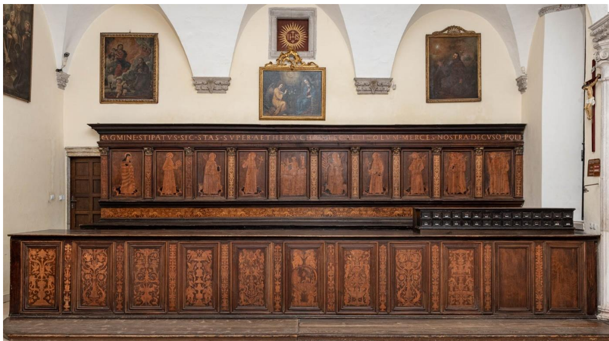
Veliki i mali ormar