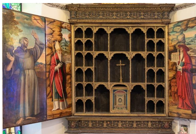
Otvoreni oltar moćnik