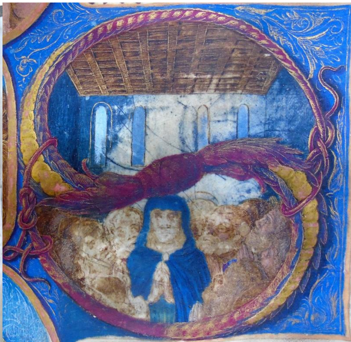
Minijatura u gradualu „H“