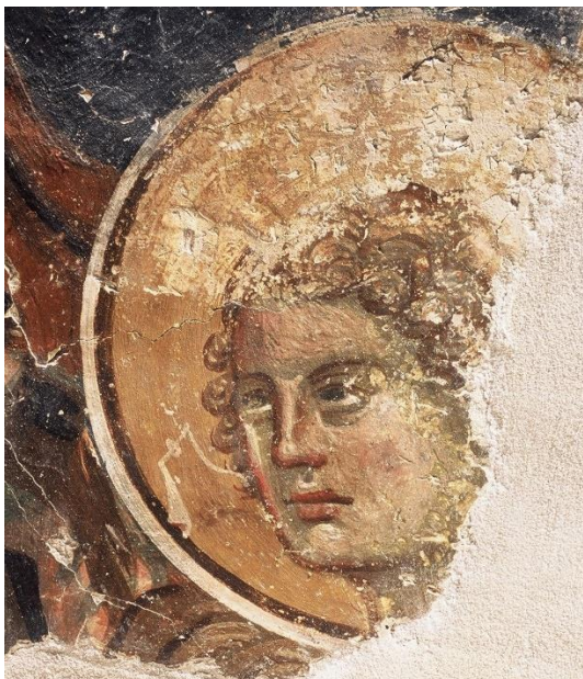
Anđeo Mihael, detalj ostatka freske