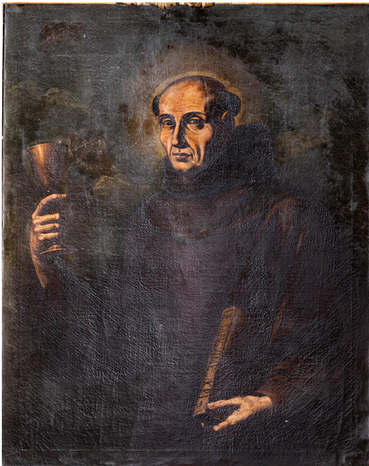
Slika sv. Jakova Markijskog na zidu sakristije