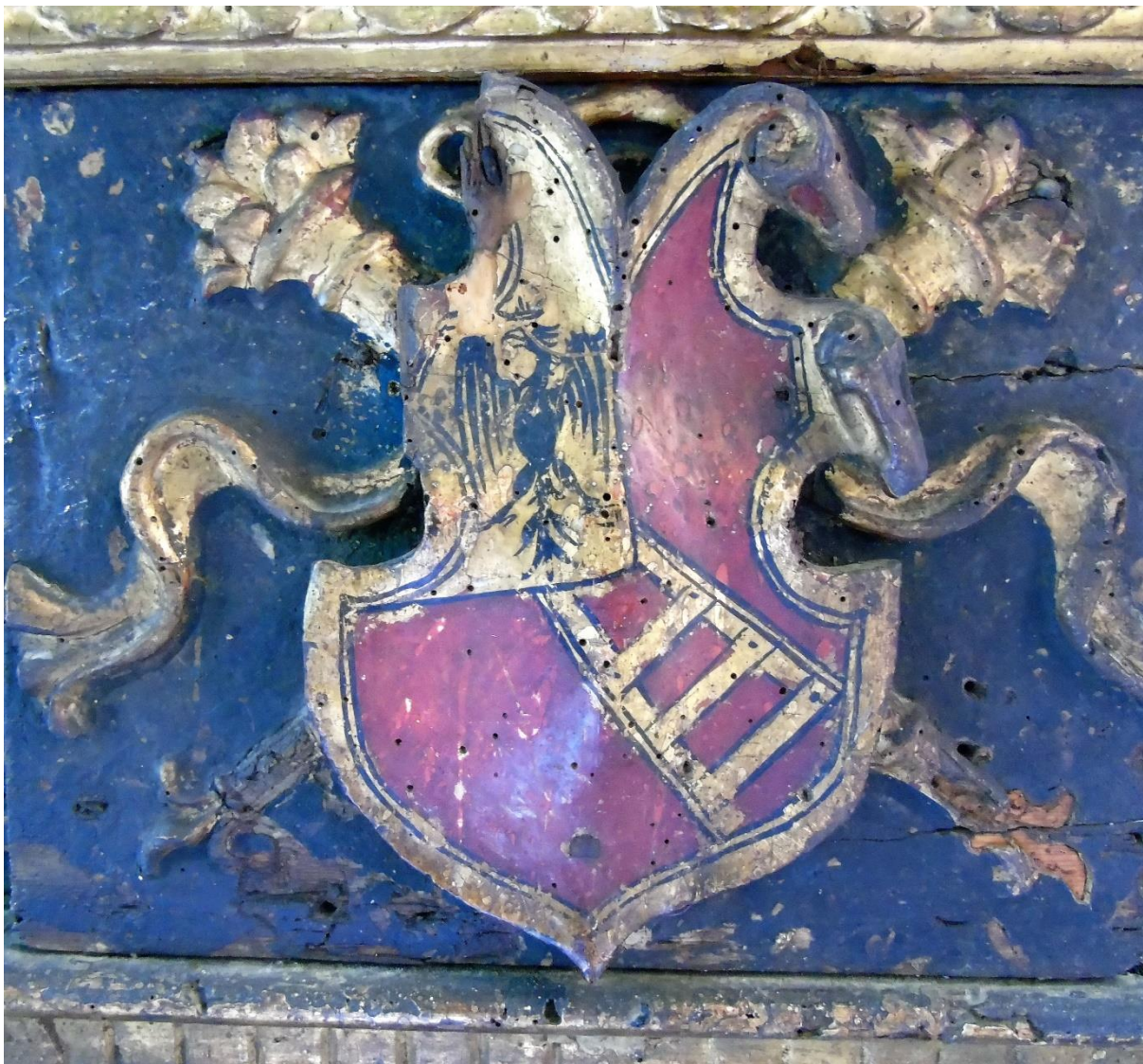
Grb obitelji Bunić na oltaru moćniku