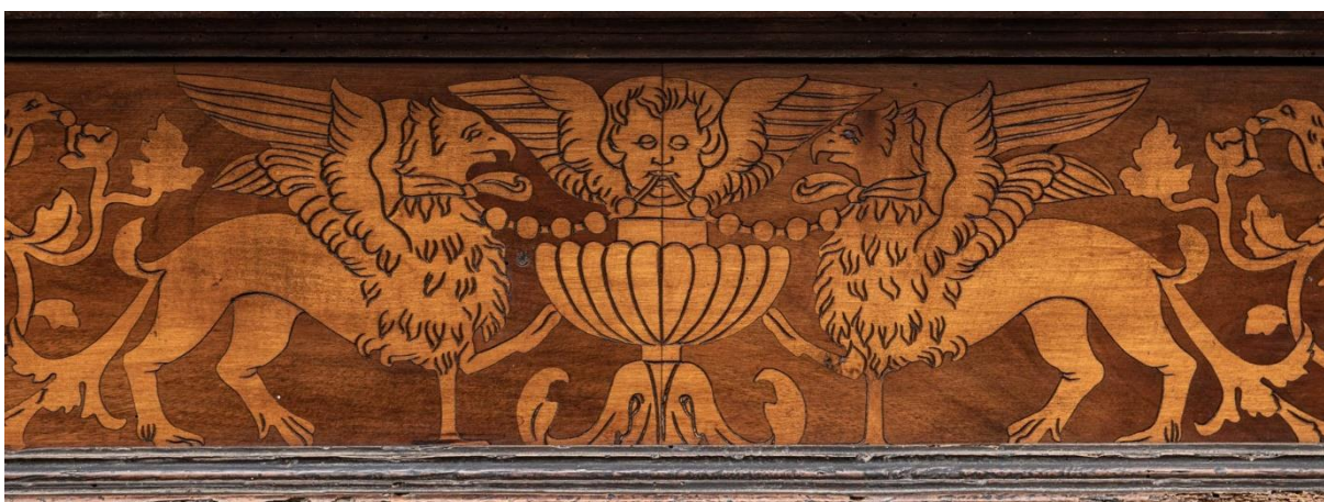
Grifoni su vrlo česti motivi na ormarima