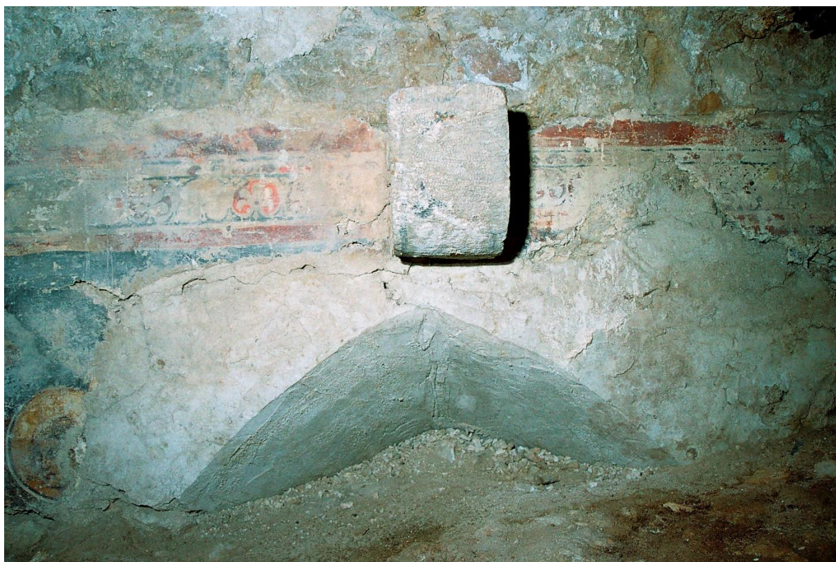
Vrh sačuvanog ranijeg gotičkog prozora

na istoj visini od poda, a sezali su gotovo do stropa, pa su mogli biti visoki oko 400 cm. Za vrijeme dok su oni još bili na toj visini, čini se, napravljen je veliki ormar i njemu pripadajući niži ormar. Ormari su bili smješteni ispod tih prozora uz istočni zid. Tu nisu mogli dugo ostati, jer je u sakristiju 1509. ugrađen svod 12 pa su prozori morali biti spušteni prema podu. 13 Zbog toga su ormari premješteni uz sjeverni zid. Nedugo nakon toga sakristija je dobila kapelu. S njom je preživjela i veliki potres 1667., kada je srušena i izgorjela crkva sa zapadnim samostanskim krilom. Ipak, u svodu sakristije prema istočnoj strani vidljiva je „neravnina“, koja se proteže sve do pola kapitularne dvorane, što je zapravo pukotina nastala za jednog od potresa. 14 Prema usmenoj tradiciji sakristija je bila jedna od rijetkih sačuvanih velikih svećanih prostorija u gradu nakon velikog potresa, pa je u njoj navodno održana sjednica Vlade Dubrovačke Republike. Tradiciju potkrepljuju drvene stolice obložene devinom kožom što su tada ostale u samostanu, a danas su u samostanskoj knjižnici.