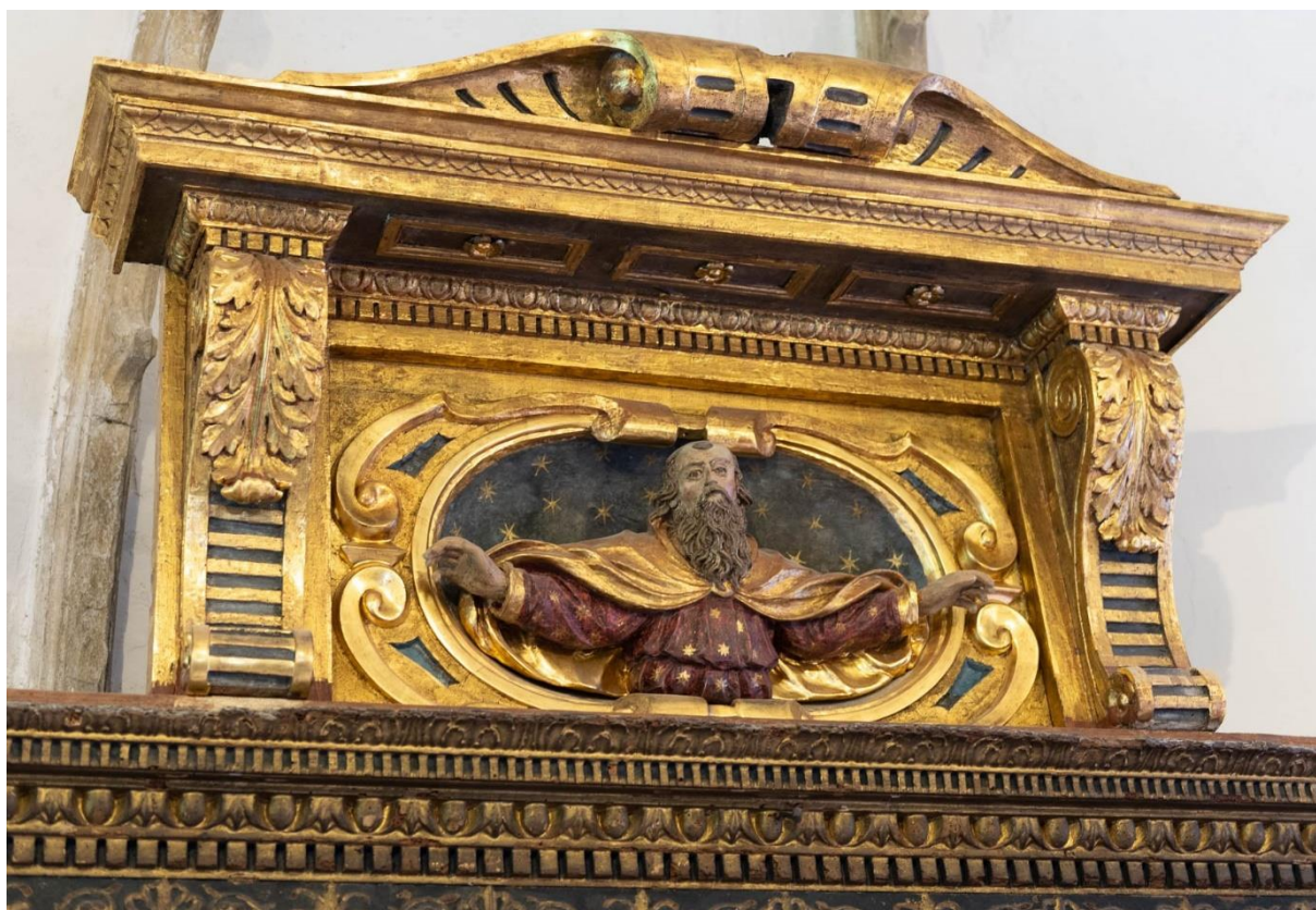
Detalj ormara, atika s poprsjem Boga Oca

Još jedna zgodna, iz novije povijesti, vezana je za ovaj oltar. To je sudbina atike oltara s drvenim poprsjem Boga Oca. Atika je, zbog oštećenosti ili možda zbog namjere njezine obnove, bila skinuta. Nakon toga, na što su vjerojatno utjecale i nedaće što ih je donio Domovinski rat, nekoliko godina provela je zaboravljena u samostanskom podrumu. Nakon što je pronađena, obnovili su je stručnjaci Hrvatskog restauratorskog zavoda iz Dubrovnika, i 2008. ponovno je montirali na oltar.