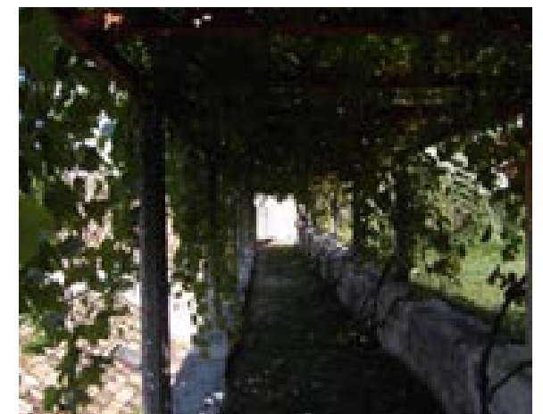
Odrina u kolovozu 2009.