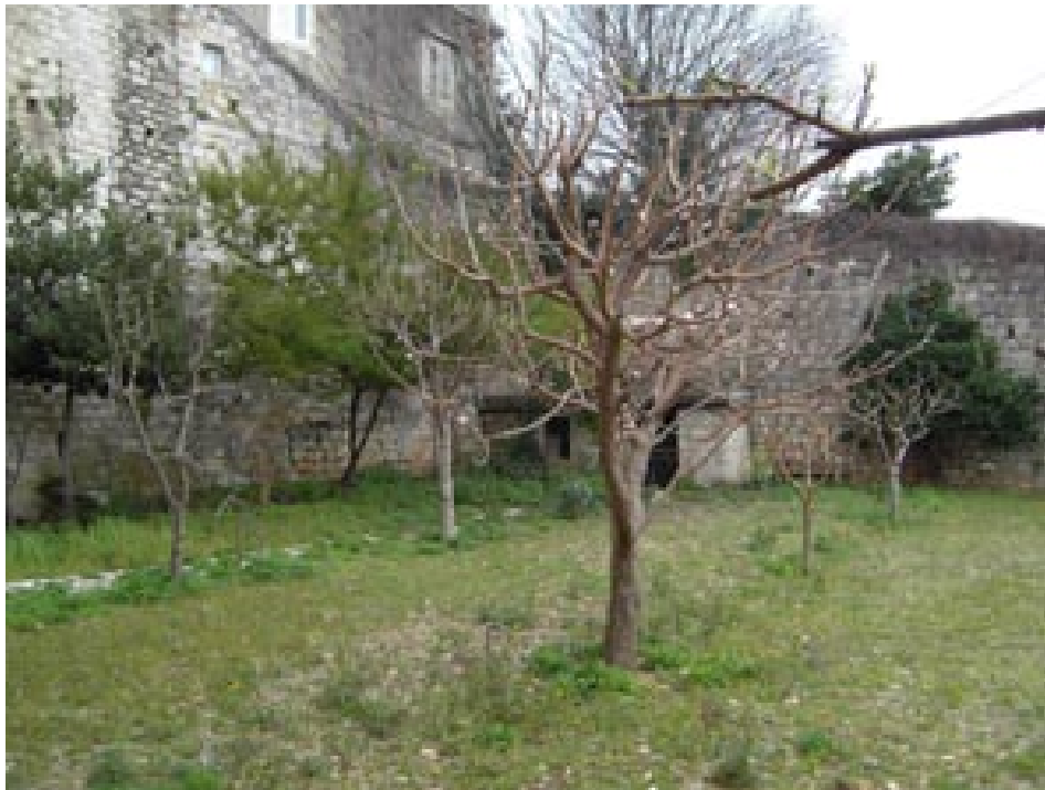
Dubrovački vrt nakon fra Damira