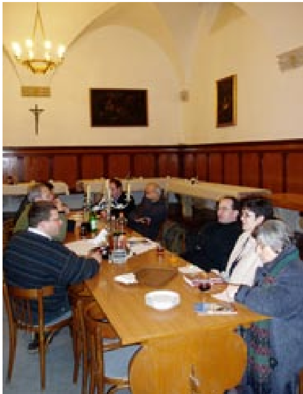
Ekipa HKR-a u Maloj braći

odijelim od Tebe, ni ovdje ni u vječnosti, veži me – ako treba – konopcima svoje ljubavi. Ne dopusti da ikada s uma smetnem tvoje čovjekoljublje u kojem si – radi nas ljudi i radi našega spasenja prihvatio i podnio muku i križ. Snagom svoga svetoga Duha osposobi me da i ja mogu reći Ocu nebeskom: Budi volja tvoja! Ne kako ja hoću, nego kako ti hoćeš, tako neka bude.