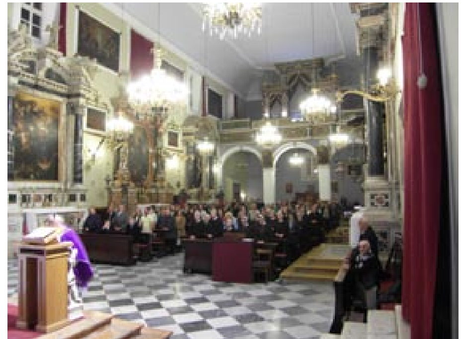
Sa zadušnice u Maloj braći