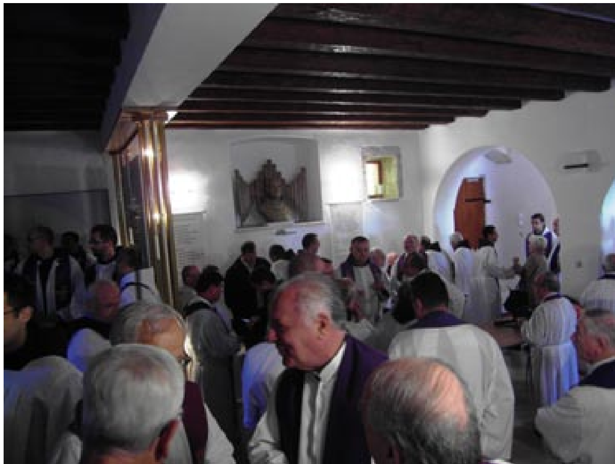
U holu magistra

Poslije, malo - pomalo dolazi sve više ljudi, časne sestre, svećenici, redovnici, poznata lica iz Pule, Rijeke, Dubrovnika, Splita, Zagreba, Mostara, i drugih krajeva... Uoči svete mise pun je hodnik svećenika u misnim odijelima, koji čekaju formiranje procesije.