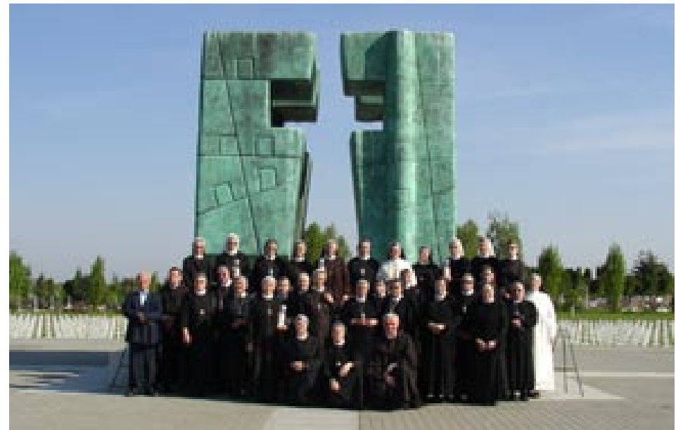
U Vukovaru 2005.

Nekoliko je puta nakon Domovinskog rata posjećivao Vukovar. Tu je očito ponovno u duhu proživljavao muke koje je u tom gradu doživio. Tamo je fra Damir išao i iz Dubrovnika, kao član delegacije redovničkih zajednica, 3. svibnja 2005., povodom