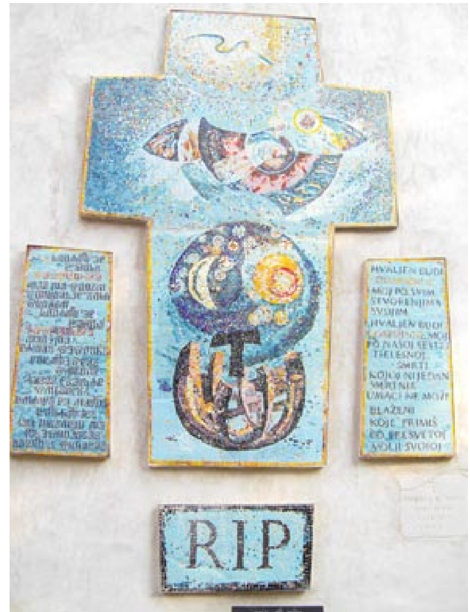
Na zidu košljunskog groblja

Tako je govorio fra Damir u jednostavnoj i živoj vjeri. To svjedočim s mnogima od vas, i to je razlog za molitvu da u ovaj bolan rastanak, sada prekriven oblakom fra Damirove tjelesne smrti, i nas obasja Svjetlo Kristove vječnosti.