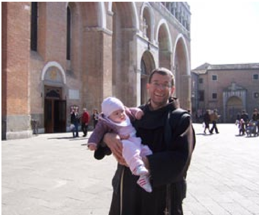
U Padovi s malom prijateljicom

Ancora oggi, il solo fare memoria di fra Damir, ci pone nella stessa dimensione di gioia. Fra Damir, in conclusione, ha infiammato il cuore di noi giovani ventenni come nessun altro ha saputo fare. Lo ha fatto alla sua maniera. Non accondiscendente, ma affettuosa; non stravagante, ma originale; non eclatante, ma divinamente illuminata.