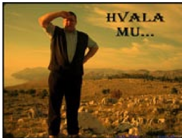
Slika i riječ govore isto