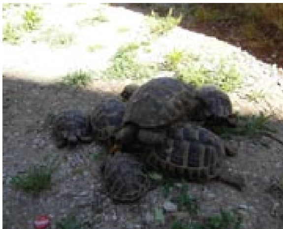
Čančare u dubrovačkom Damirovom vrtu

U radovima su fra Damiru ponekad pomagali prijatelji i đaci iz srednjih škola u kojima je predavao vjeronauk. Vrlo često dovodio je skupine đaka, profesora i prijatelja u svoj vrt, uživajući s njima u toj oazi prirode u kamenom Gradu. Uz to često je pješao po konavoskim brdima, ali i tu rekreaciju spajao je s korisnim. Skupljao je raznovrsne trave, sušio ih i od njih pravio čajeve. Proizvodio je za nas i za