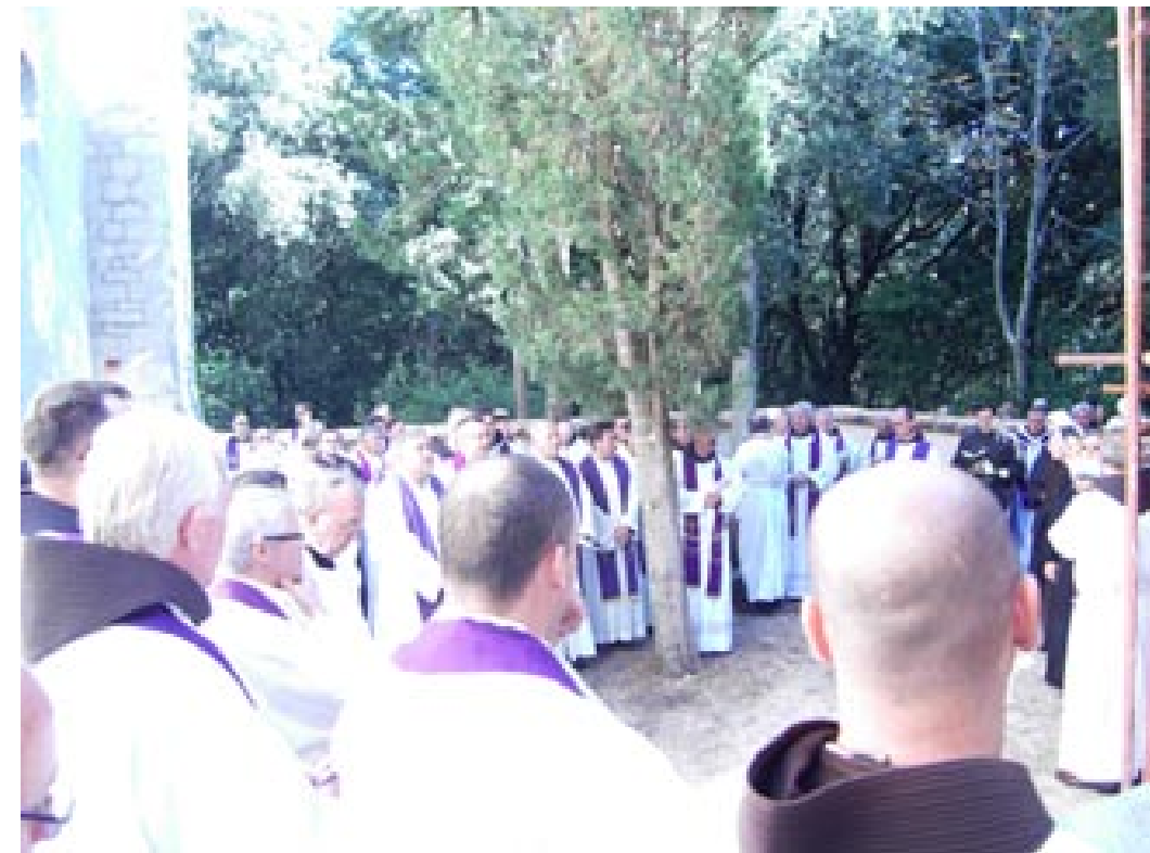
Na košljunskom groblju

Moram priznati da sam ostao u tom zabezeknutom stanju podulje. Kada sam razmišljao nad čitanjima Božje riječi u ovoj misi i došao do riječi: »Svjetina sve to vidi, ali ne shvaća«, zastao sam, našao se u tim riječima i osjetio kako sam malen i ograničen. Osjetio sam da meni pristaje s pravom Božji prigovor iz Jobove knjige: »Tko je taj koji bezumnim riječima zamračuje božanski promisao« (Job 38,2)? Zar je meni više stalo do dobra svećenika, redovnika i Crkve nego Bogu? Tko sam ja da određujem što je to pred Bogom gubitak, a što dobitak?