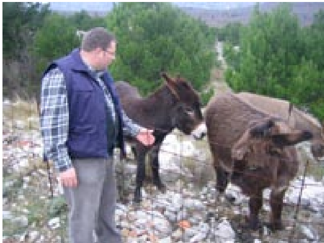
Na farmi u Konavlima

je svoje divljenje i, naravno, dodao cijelu listu onoga što bi još u vrtu trebalo napraviti. Ponovio sam mu tada opet onu rečenicu koju sam češće govorio u vremenu kad je on bio tu s nama: »Imamo mi i prišnjih stvari.« Ipak, nešto od toga što je on nabrajao, učinili smo. U siječnju 2010., kad smo obrezivali loze,