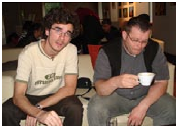
Jedna od kava

Kavu je često pio i u vrtu. Tu je također na kavu zvao prijatelje. Bio je to njegov način kako se sprijateljiti s čovjekom, biti zajedno s njim, upoznati ga, i eventualno mu pomoći.