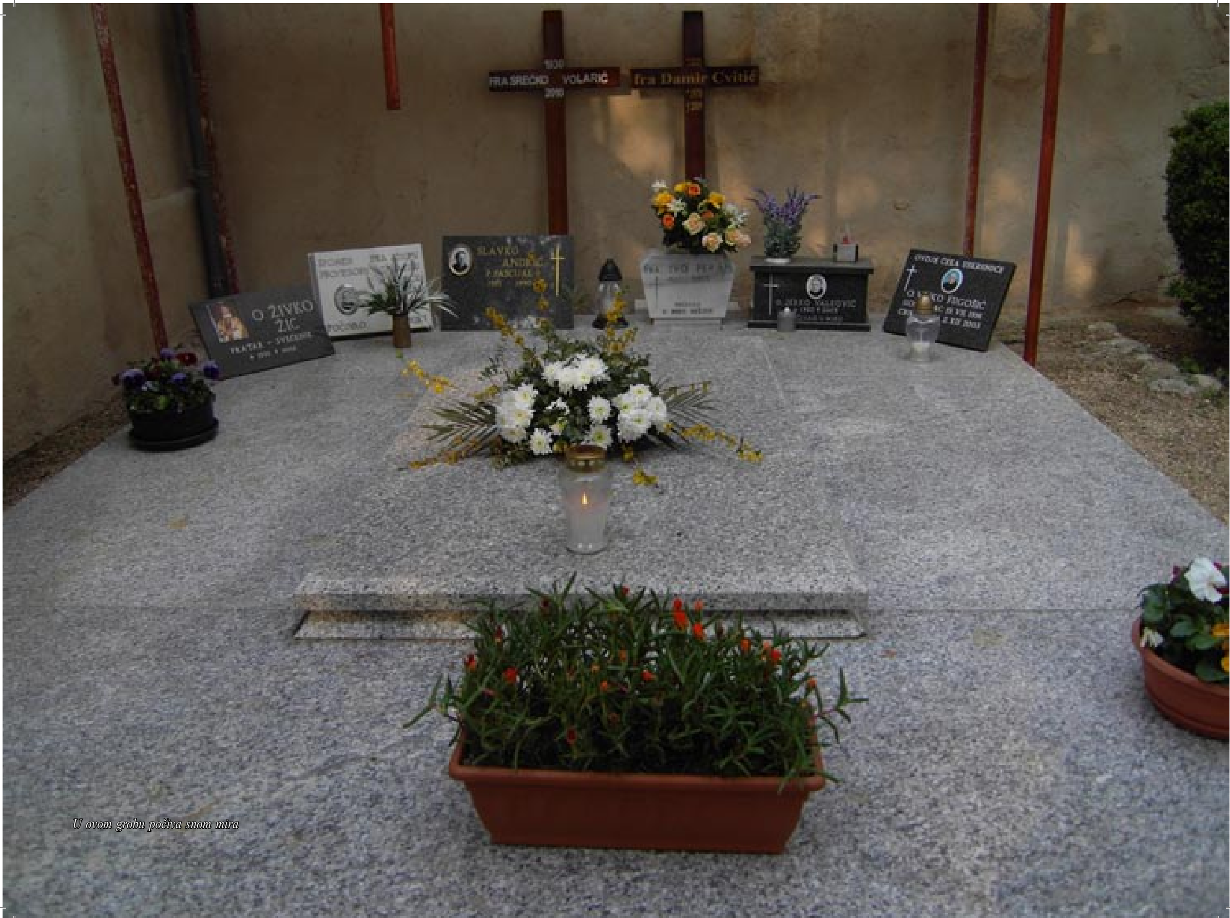
U ovom grobu počiva snom mira