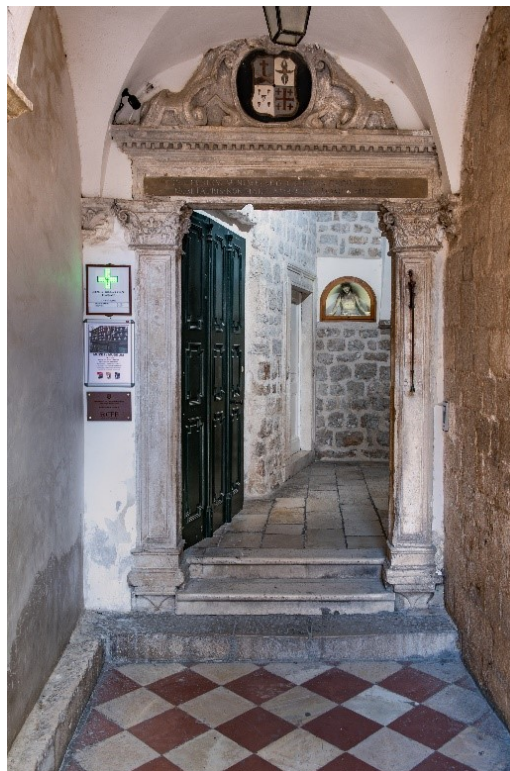
Glavni ulaz u samostan