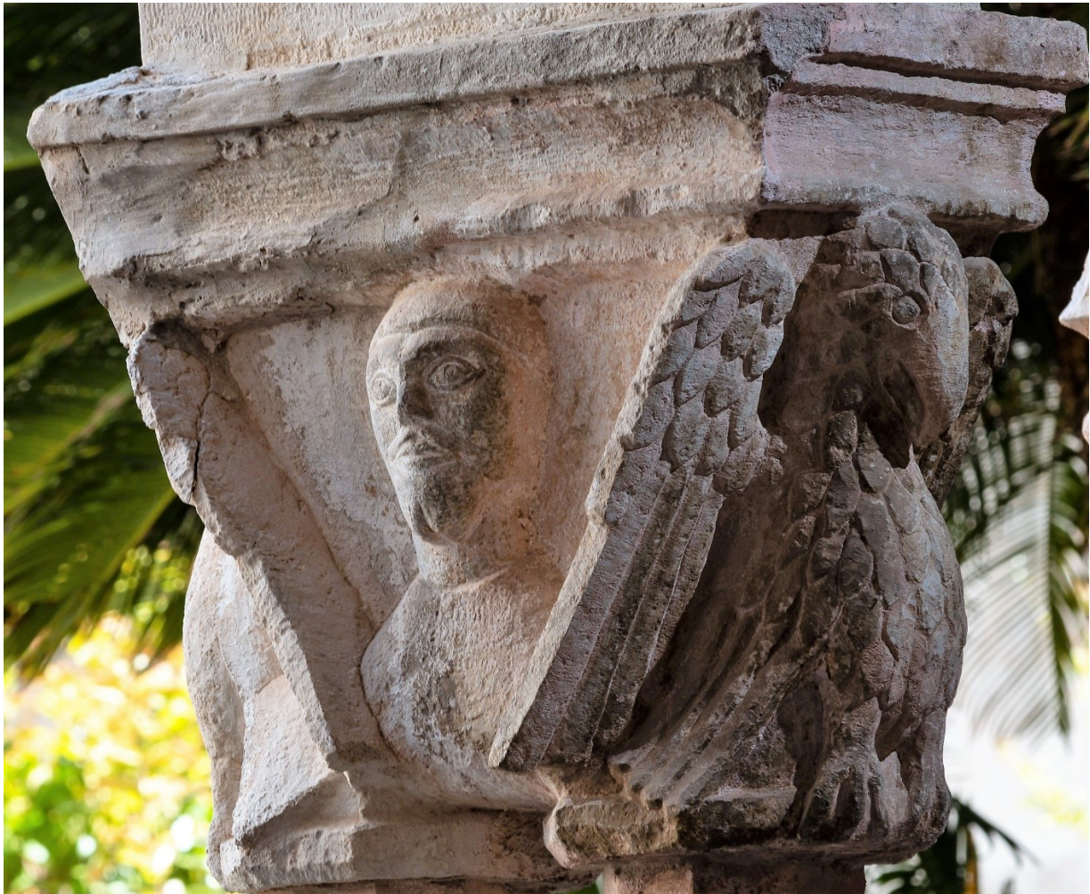
Pretpostavljeni lik fra Vida iz Kotora

koju ovdje ne možemo tumačiti. Spomenimo samo da kapitel 1 ima figure žene i muškarca u minijaturi; kapitel 2 dva zmaja; kapitel 4 žensku i mušku sfingu; kapitel 8 četiri psa dalmatinca; kapitel 14 dvije mitološke i dvije ljudske figure; kapitel 16 dvostrukog grifona; kapitel 18 Mojsija i dva psa koji ga grizu za noge; kapitel 23 dva orla; kapitel 25 tri ljudske i jednu životinjsku figuru; kapitel 28 dva orla i redovnika; kapitel 33 četiri orla i jednog zeca; kapitel 37 šest volovskih glava; kapitel 42 četiri mitološke figure; kapitel 48 šest glava ovnova; kapitel 53 četiri glave mladića i dvije glave lavova; kapitel 54 četiri glave maskara; kapitel 55 šest glava žena; kapitel 56 tri ljudske glave (a tri su propale), i kapitel 60 šest ljudskih glava.