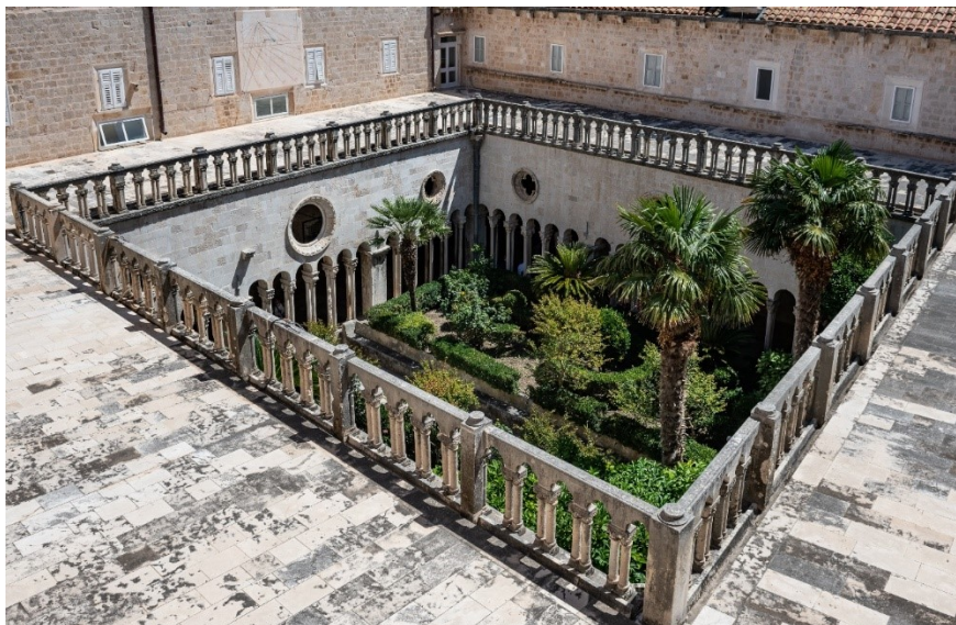
Pogled s gornje šetnice