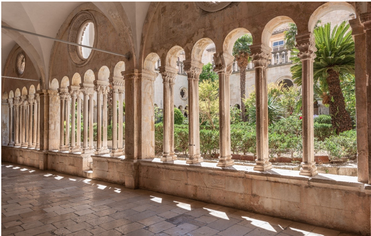
Heksafore 7, 8 i 9