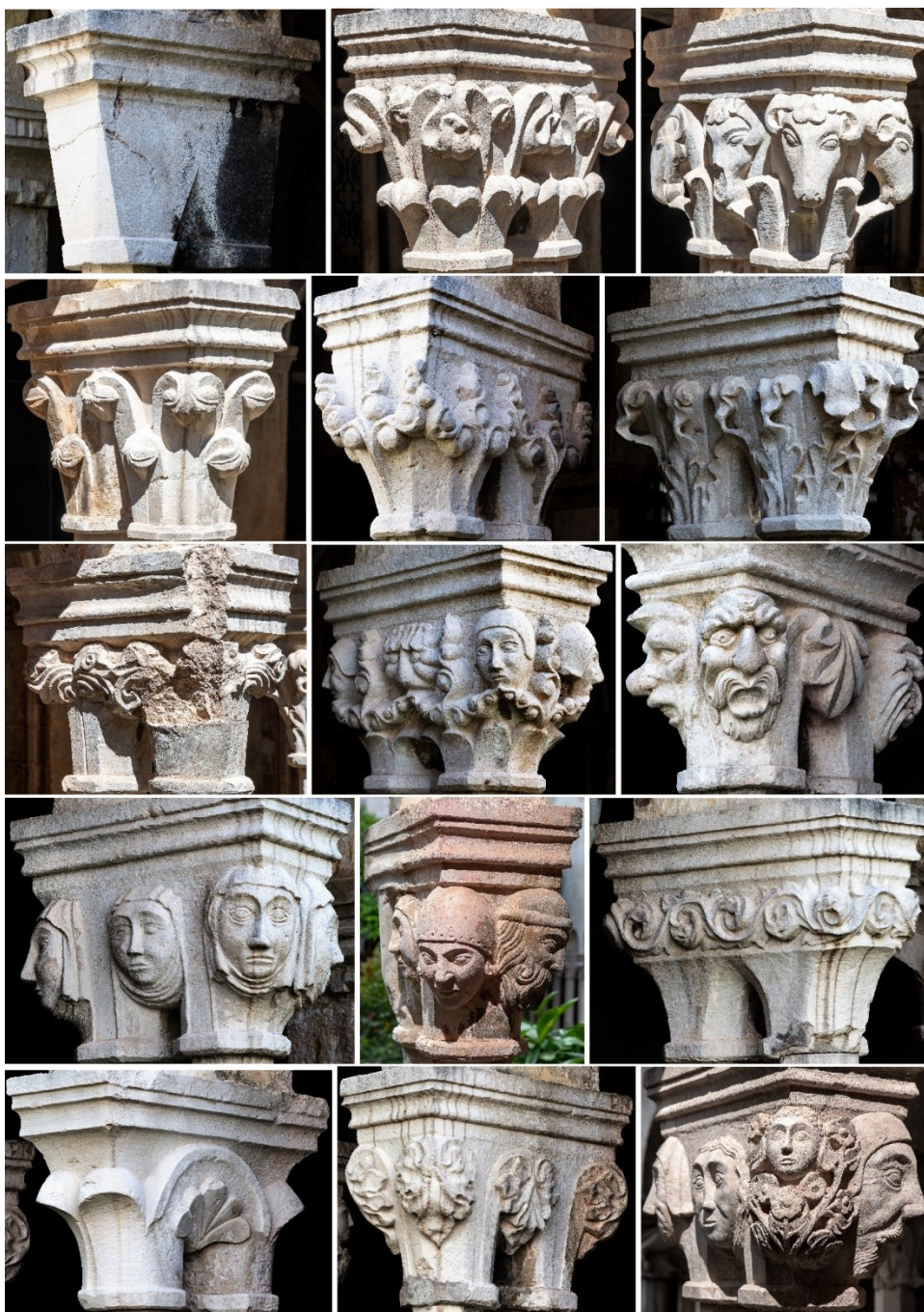
Detalji kapitela od 45 do 60

*Članak je u sličnoj formi objavljen u: Dubrovački horizonti, časopis Društva Dubrovčana i prijatelja dubrovačke starine u Zagrebu, Zagreb 2021., br. 55 godina XLV., str. 81 – 94.