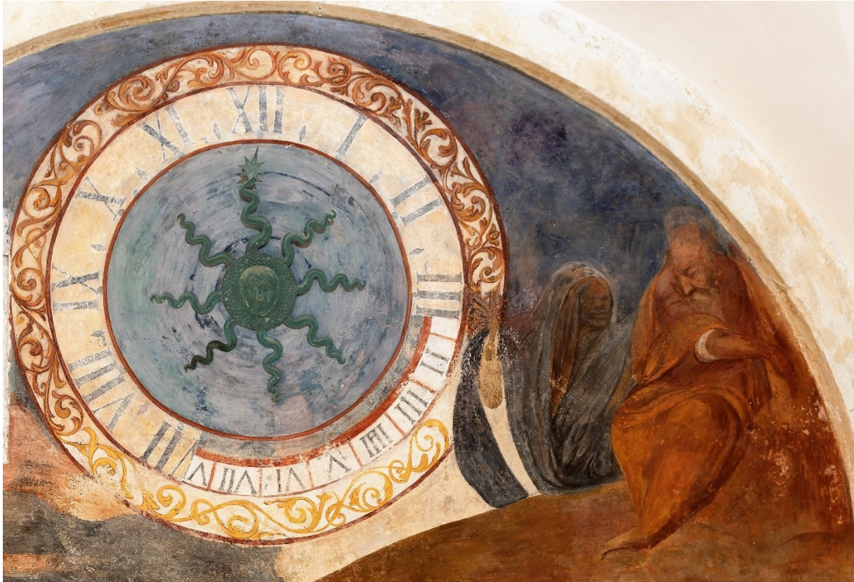
Sat fra Paška Baletina