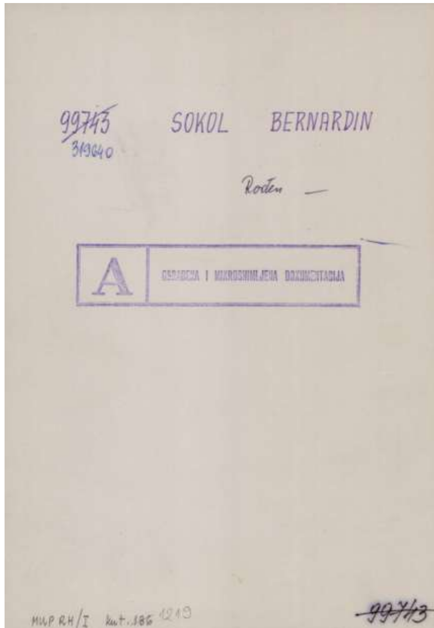
Naslovnica OZN-ine mape