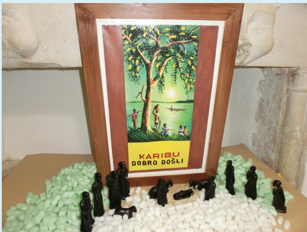
Jaslice u blagovaonici 2016.