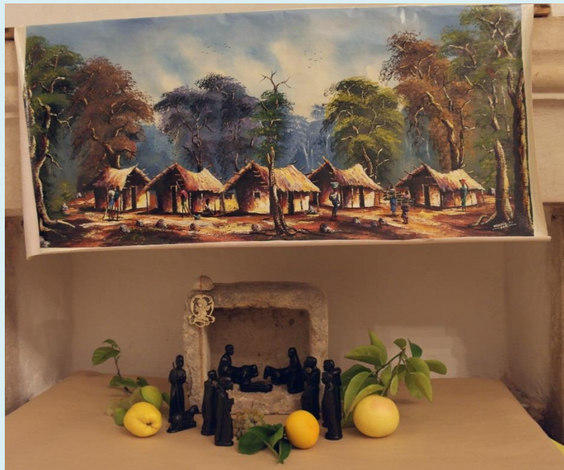
Jaslice u blagovaonici 2012.