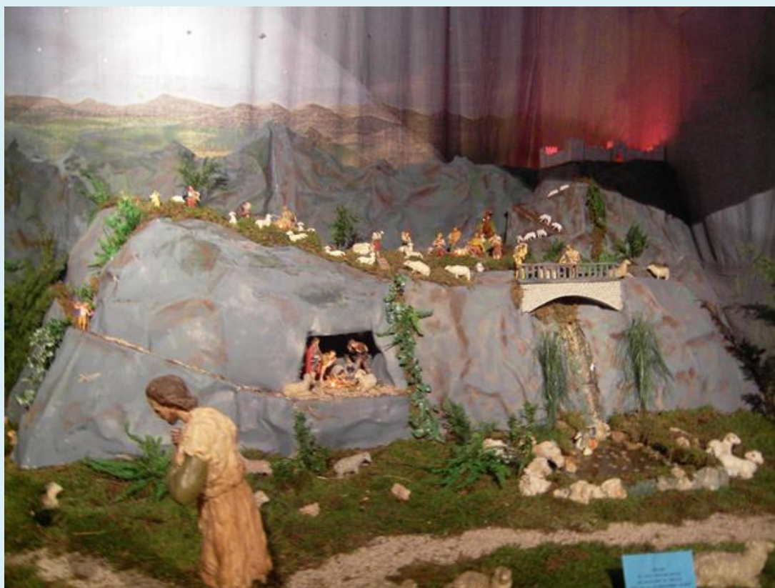
Jaslice u crkvi 2009.

Ljubav Boga prema čovjeku. A što je kod toga iznad svega važno, jest istina da to Bog nije učinio samo one noći u Betlehemu, i da to nije učinio samo jednom. To što je naš Bog učinio u onoj svetoj noći, to naš Bog čini svake noći i svakog dana za nas - stalno se rađa. I ove noći, on se rađa, i ove noći on ljega u jasele, i ove noći raspršuje tamu. Ove noći on za nas postaje smrtni čovjek, da bi mi mogli biti ispunjeni božanskim životom. Zato, dok čestitamo noćas, i ovih dana, jedni drugima Božić, radosni zbog osjećaja obiteljeske blizine i božićne topline, činimo to sa sviješću da je to radost zbog Boga koji se za nas rodio, zbog Boga koji nas ljubi, zbog Boga koji je za nas postao dijete - čovjek. Veselimo se, slavimo ga i hvalimo s nebrotjenim mnoštvom zemnika i nebesnika. Amen. 25.12.2009.