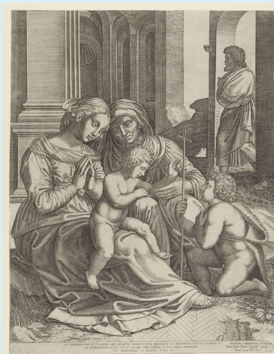
Grafika, izradio Pietro Paolo Palombo u Rimu 1571., po Raffaellovoj slici

Dubrovački franjevački samostan uz druge vrijedne slike, može se dakle pohvaliti i „Raffaellovom slikom“. Ali to i nije čudo, ako je još 29. rujna 1934. Hrvatska straža pisala o sličnoj činjenici. Pod naslovom „Umjetničko blago provincije sv. Jeronima“ u tim novinama je pisalo: „Jedna mala Madona, slikana na drvu, i koja se čuva u arhivu Male braće u Dubrovniku, a u svom crtežu, koloritu i espresiji nosi odraz Rafaelove škole...“ Ne zna se, međutim, na koju je sliku pisac toga članka mislio, i da li je ona još uvijek u samostanu.