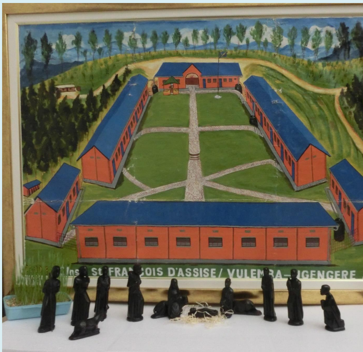
Jaslice u blagovaonici 2018.