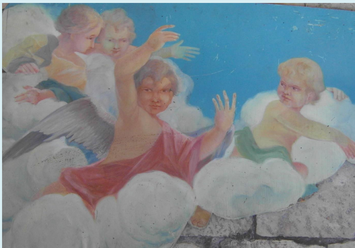
Fra Ambroz Testen, na lesonitu 1934.