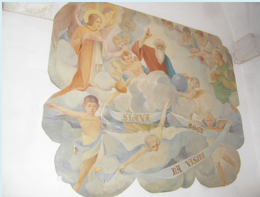
Fra Ambroz Testen, na lesonitu 1934.