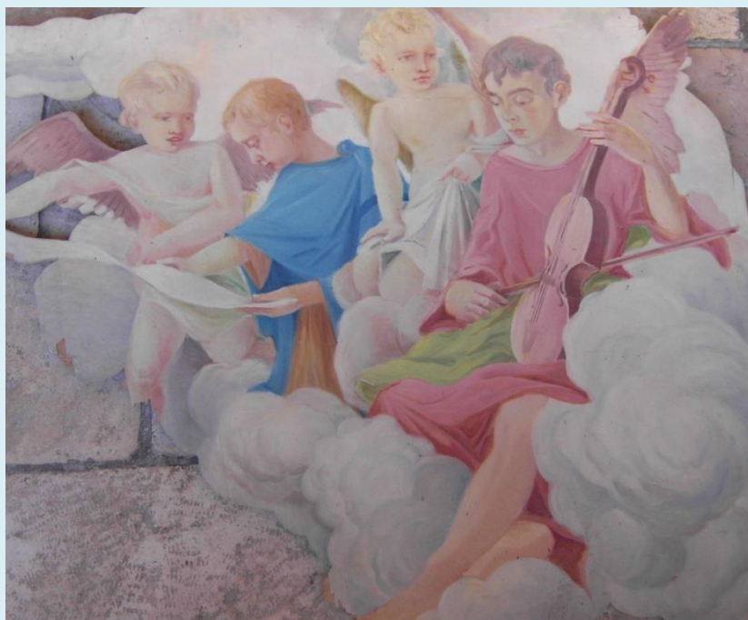
Fra Ambroz Testen, na lesonitu 1934.