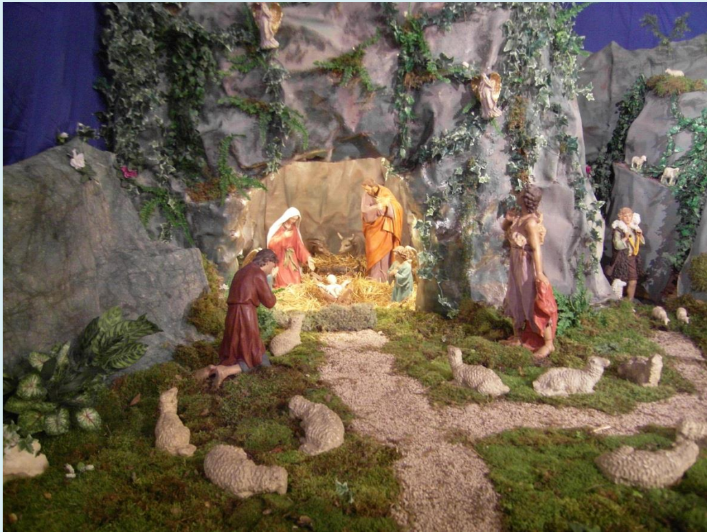
Jaslice u crkvi 2012.