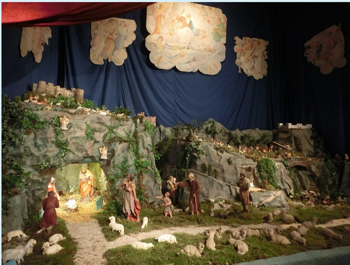
Jaslice u crkvi 2018.