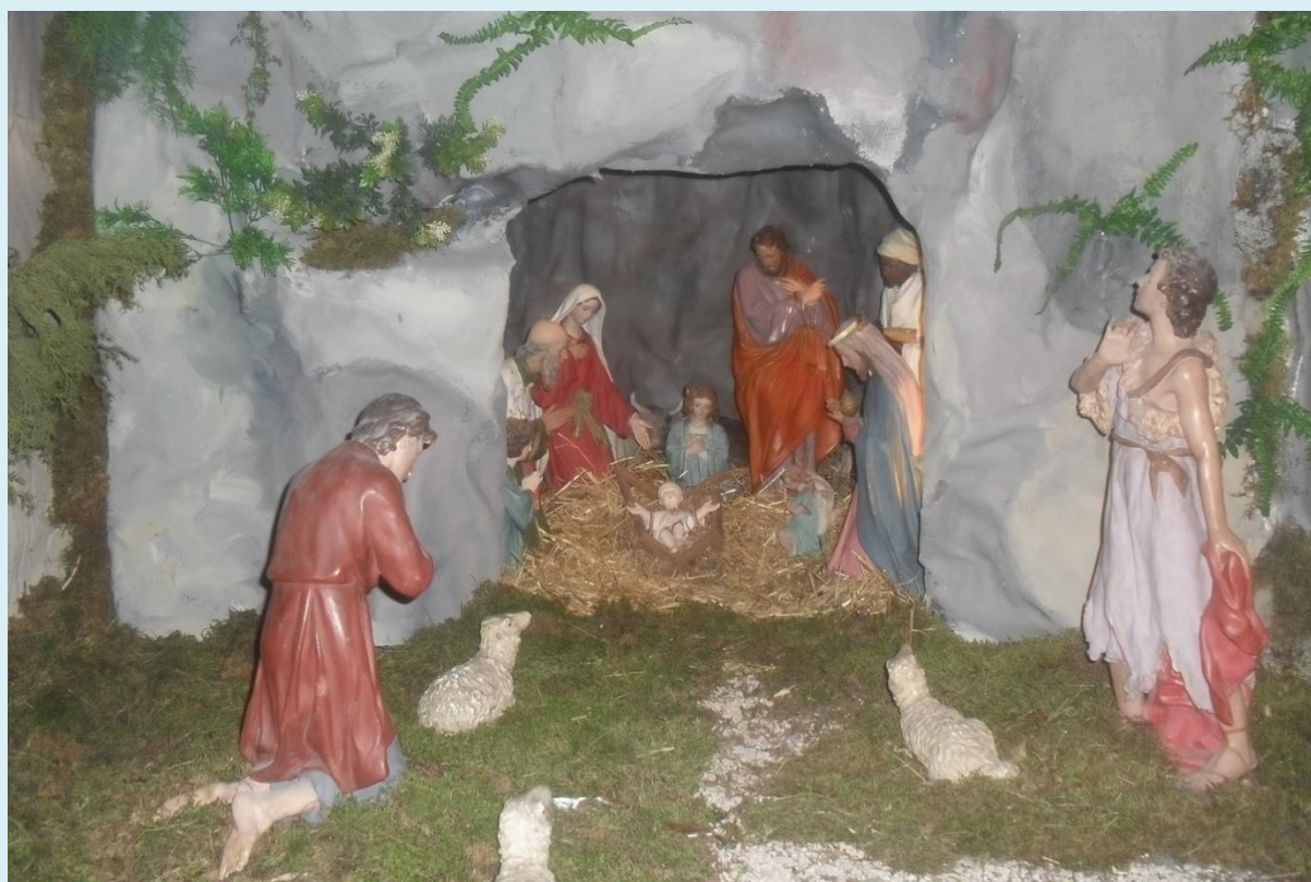
Jaslice u crkvi 2007.