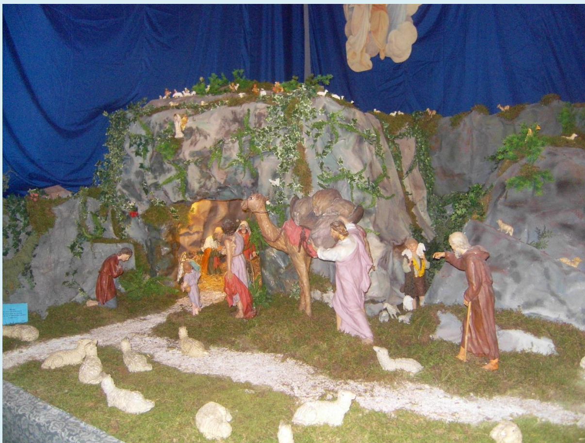
Jaslice u crkvi 2014. (detalj)