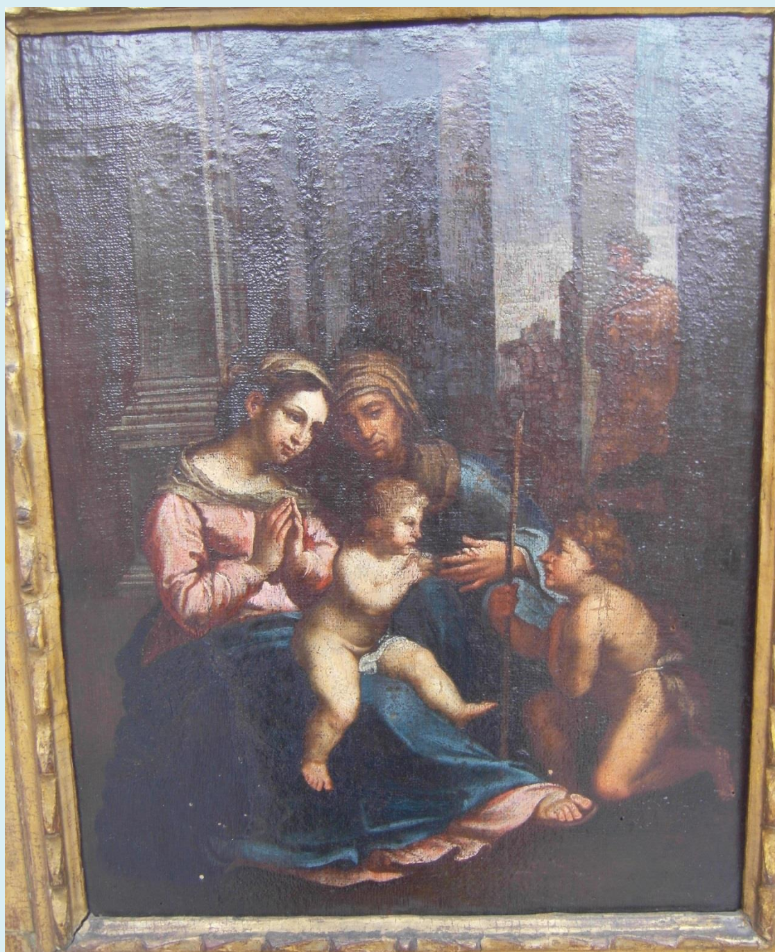
Slika samostana Male braće

Slika, ulje na platnu (dim. 49 x 39 cm) s motivom „Elizabeta s Ivanom u posjetu Mariji i Isusu“. Slika s malim razlikama odgovara većoj slici koju je naslikao Raffaello Sanzio (1483. – 1520.) (dim. 85,2 x 67,2 cm), ulje na drvu, a nalazi se u „Museo Nazionale di Capodimonte“ u Napulju. Tu sliku zovu „Gospom divne ljubavi“ (La Madonna del divino amore).