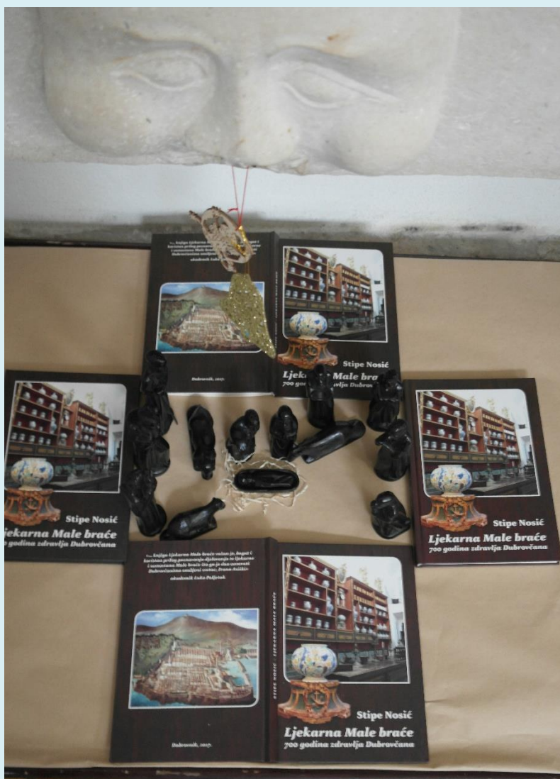
Jaslice u blagovaonici 2017.