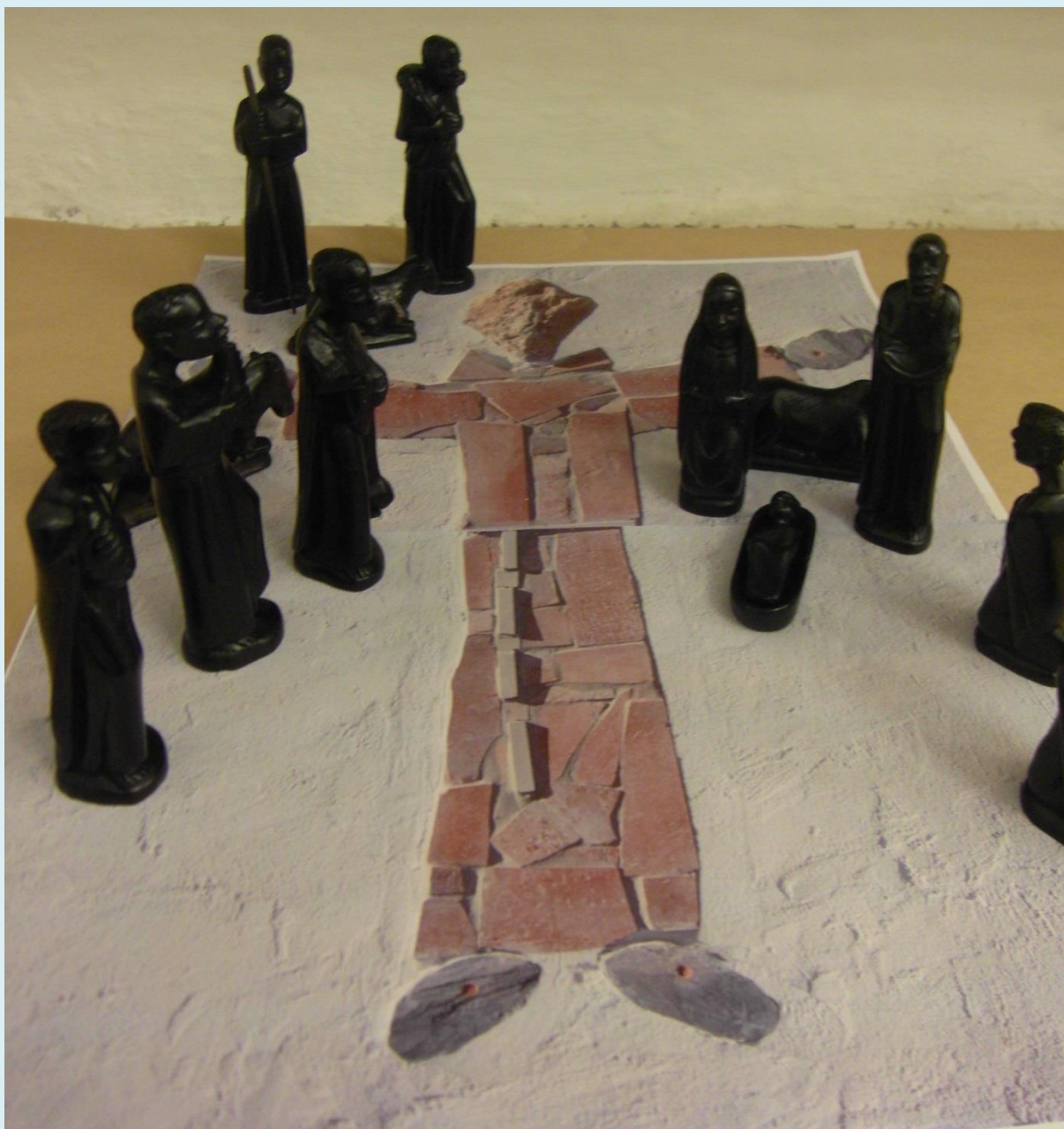
Jaslice u blagovaonici 2011.