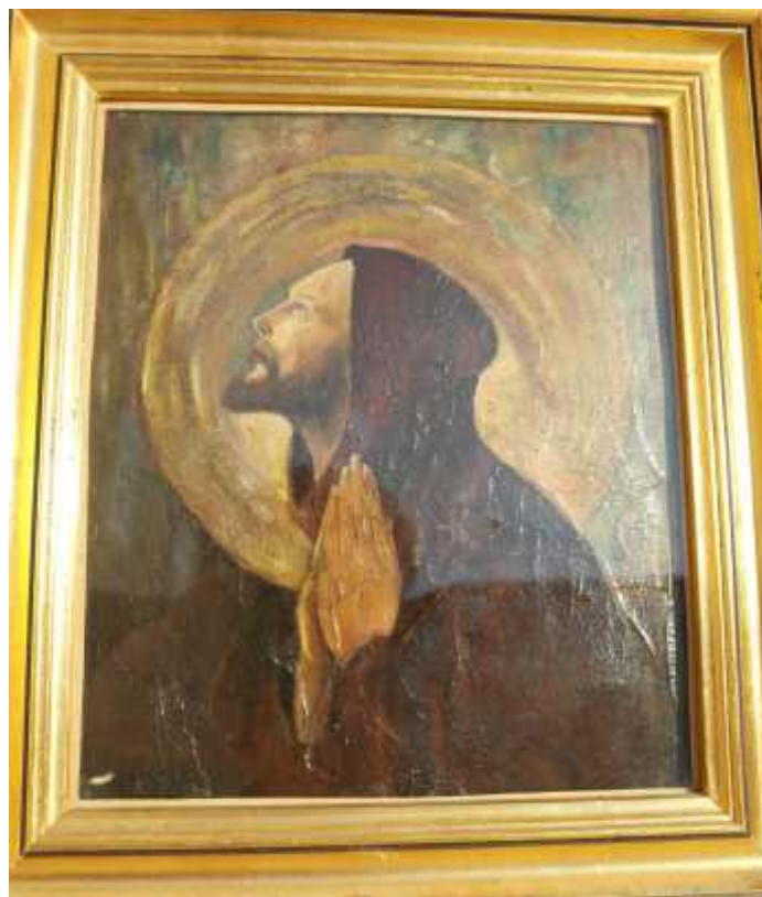
„Sv. Franjo Asiški“ (1182. – 1226.) ulje na platnu. Slika je tiskana i kao razglednica. (inv. br. 470).