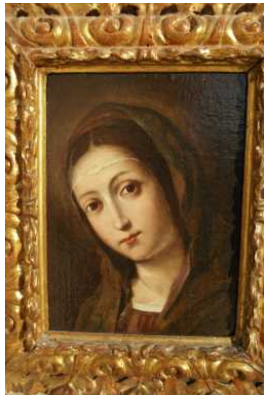
Dubrovačka Gospa (nalazi se u samostanskoj kapelici)