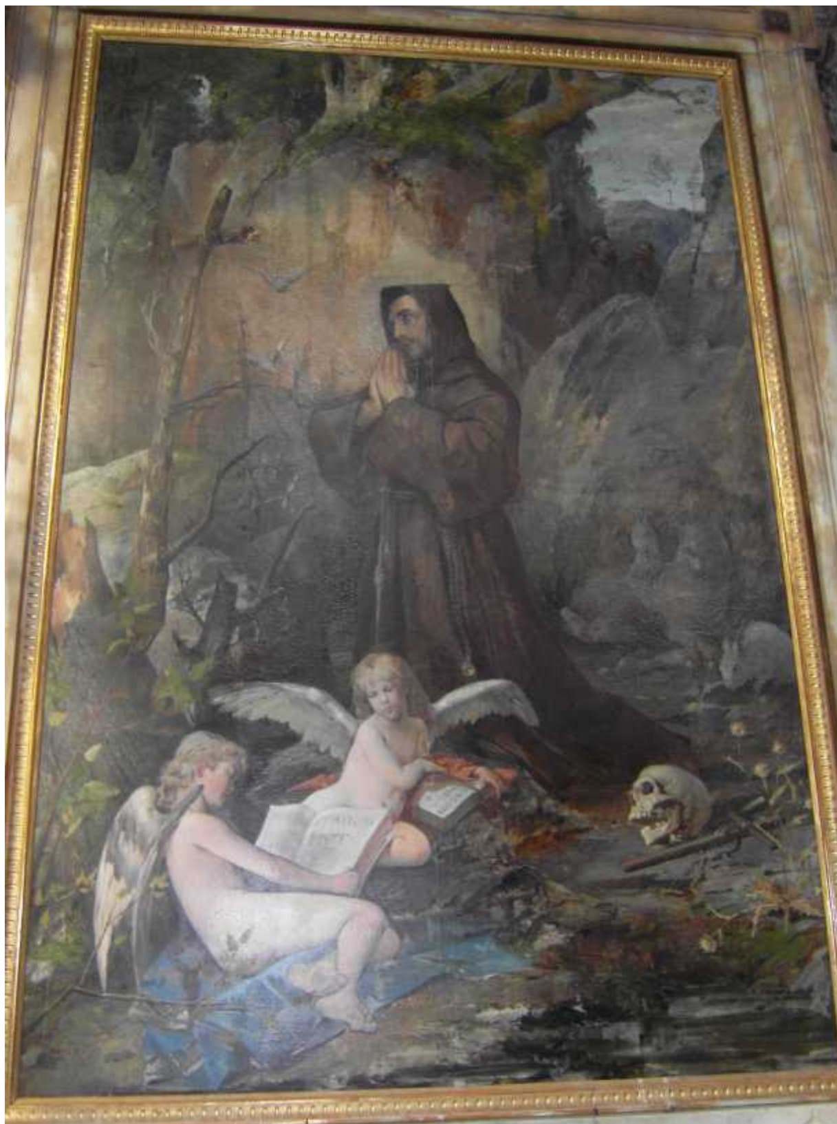
Pala na oltaru sv. Franje