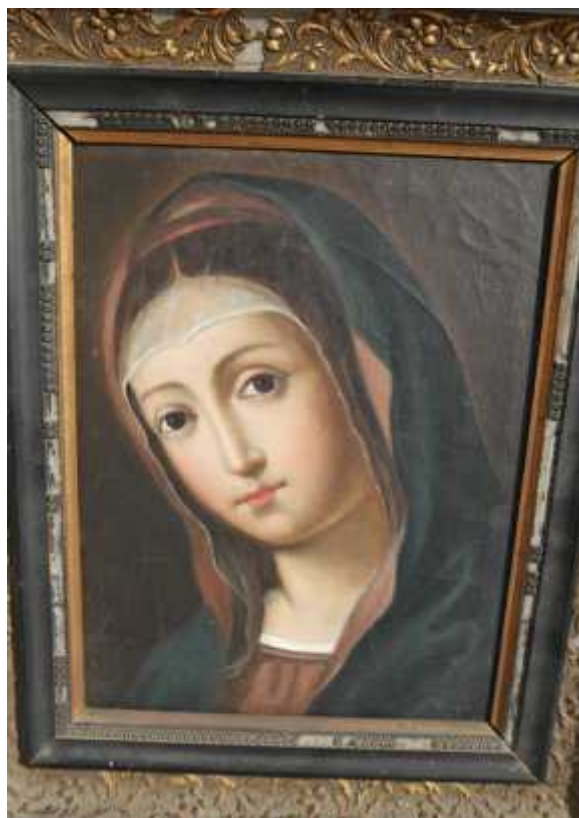
Dubrova ka Gospa, s potpisom „Giovanni Iveglia 1809.“