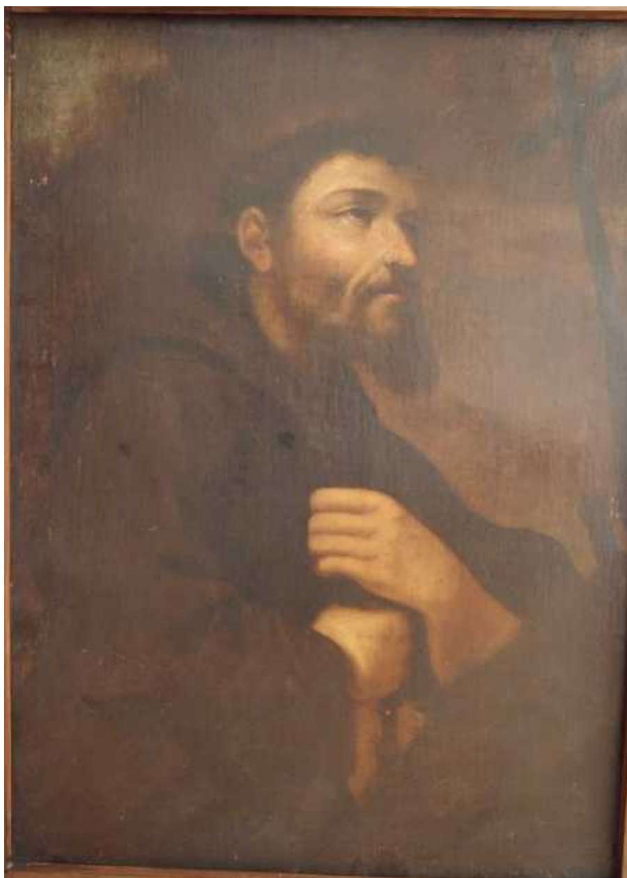
Sv. Franjo Asiški u molitvi

„Sv. Franjo Asiški u molitvi“, ulje na platnu (72 x 98,5 cm.) (inv. br. 5). Slika je restaurirana u Splitu 1976. Za nju, kao i za mnoge druge slike koje čuva samostan Malebra, nema podataka. Ova upućuje na Medovićev stil, i ako je njegova mogla bi biti ona o kojoj govori izgubljeni dopis kojeg je Medović 19. siječnja 1883. uputio provincijalu. 43