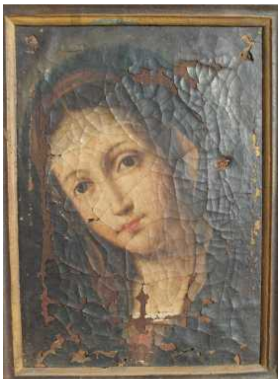
„Sassoferrato“ = Giovanni Battista Salvi

osamdesetih godina prošlog stoljeća a nalazila u crkvenom koru iza velikog oltara, što je i znak da je smatrana vrijednom i da je imala određenu kultnu ulogu. Budući da je dosta oštećena, skinuta je i bila do nedavno negdje odložena u samostanu, pa se u novije vrijeme nije ni mogla povezivati sa slavnim talijanskim slikarom, autorom mnogo različitih „madonna“. I drugi su umjetnici obojito kopirali tu sliku, jer joj se kopije nalaze u nekim dubrovačkim kućama, a poznata je pod imenom „Dubrovačka Gospa“. Jedna je od njih ukomponirana na vešnoj slici s anđelima 34 u samostanskoj kapelici Male braće na 1. katu (inv. br. 275). Sudeći po spomenutom natpisu na okviru originala, može se pretpostaviti da je slikar vjerojatno znao ime autora originala. U ovom se samostanu uvaju još tri takve slike na platnu (inv. br. 40 – 42). Napravljene su u istom stilu, a jednu, onu s inv. br. 40, na polećeni platna potpisao je autor, s godinom rada: „Giovanni Iveglia 1809.“ Riječ je o Ivanu Ivelji – Ohmućevu Gašparovu. 35