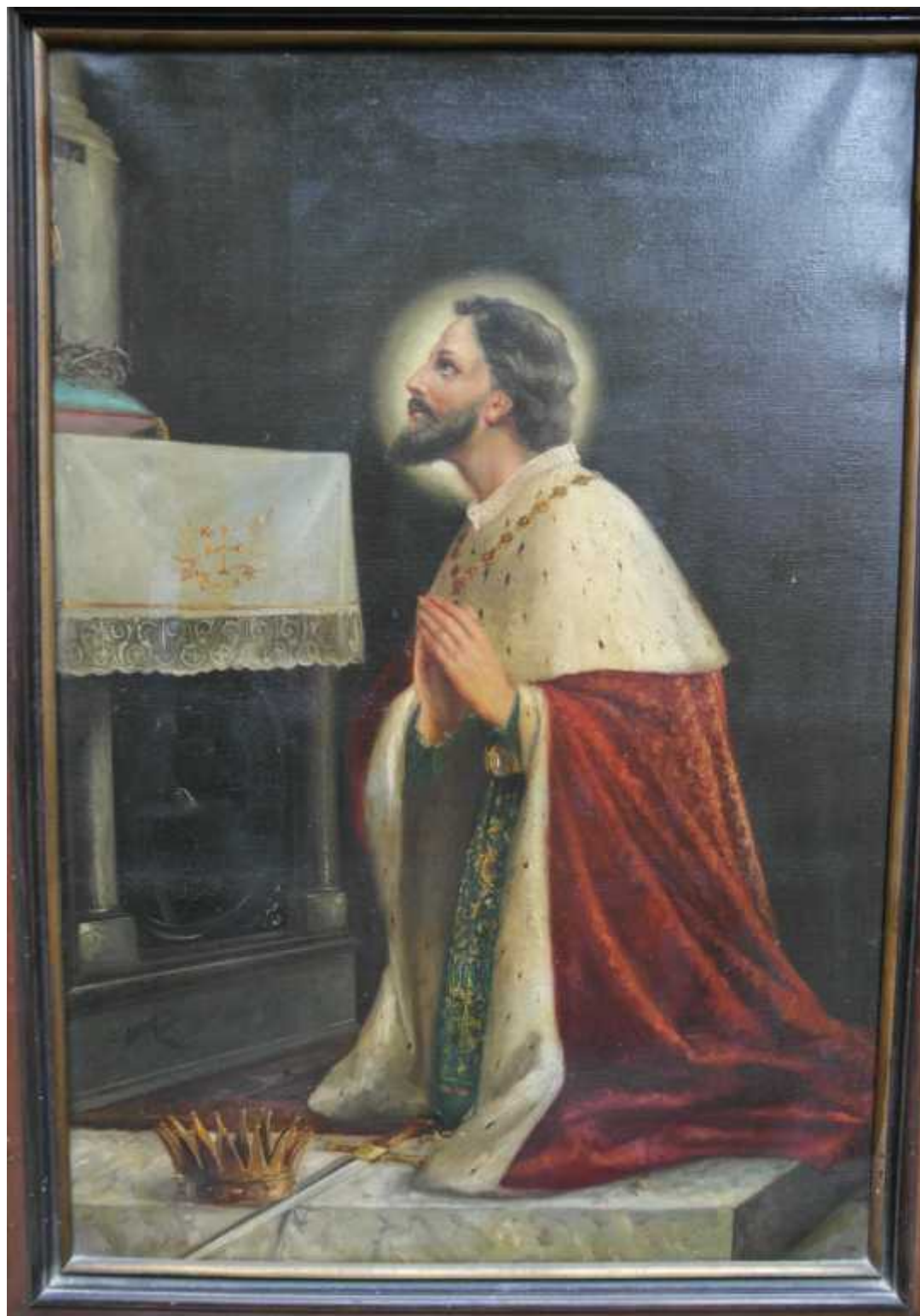
„Sv. Ljudevit" (1214. – 1270.), ulje na platnu. Svetac je bio francuski kralj i franjeva ki tre oredac. Slika se nalazi se u kapelici Presvetog Trojstva (inv. br. 411). Sliku su vjerojatno naru ili lanovi Franjeva kog svjetovnog reda. U ormaru te kapelice bila je smještena i priru na knjižnica lanova Franjeva kog svjetovnog reda.