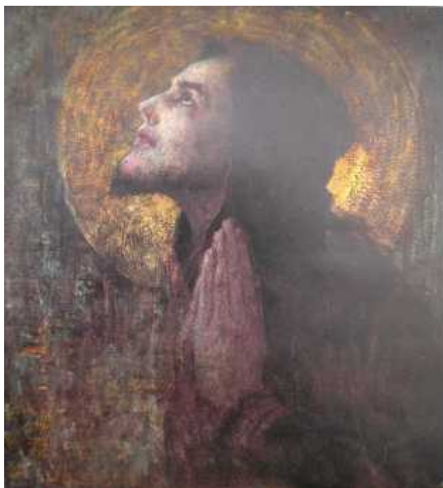
Medovi eva slika sv. Franje, sli nog izgleda i u gotovo istoj pozi, tiskana je u boji još 1906. u Kolu Hrvatskih umjetnika, izdala Matica Hrvatska.