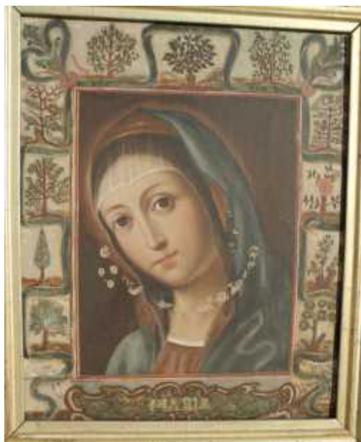
Dubrova ka Gospa s crtežima biljaka