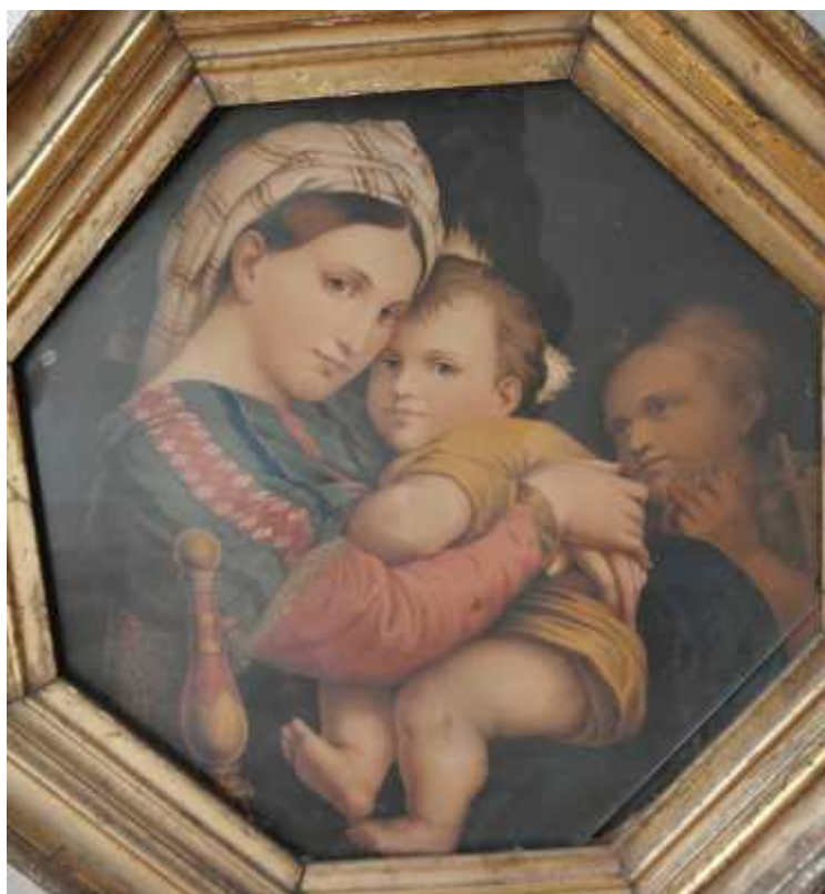
Otisak slike Madonna della sedia

Dubrova koja katedrali naslikana na drvu, odnosno u Palazzo Pitti u Firenzi na platnu, zaokupljala je Medovića i kasnije za vrijeme njegova studija. Zanimljivo je njegovo mišljenje da je slika u Katedrali Rafaelov original, a ona u Firenzi da je „kopija te, izrađena od Rafaela ili vjerojatnije od jednog od njegovih učenika“ 28 . Otisci ove Rafaelove slike bili su posebno važni u Medovićevu vrijeme. Jedan od njih (možda i ovaj koji se čuva u Maloj braći?), koristio je Medović za izradu crteža, a pomogao mu je, kako je već spomenuto, da dođe do studija slikarstva u Rimu. 29