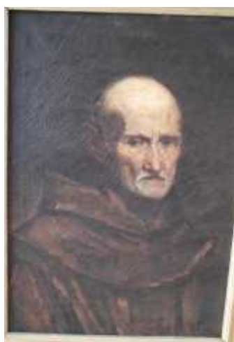
Fra Luka Wadding

- „Portret fra Luke Waddinga“ 36 , ulje na platnu, (inv. br. 117). U desnom donjem kutu stoji natpis: P. C. M. (= (P)ater C(elestinus) M(edovi )) 37 . Portret je 1952. visio u knjižnici samostana, kako je zabilježio Mijo Brlek. 38