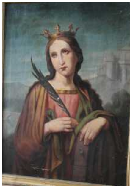
- "Sv. Katarina Aleksandrijska", ulje na platnu. Svetica je zaštitnica djevojaka, sveu ilišta i studenata... (inv. br. 316).